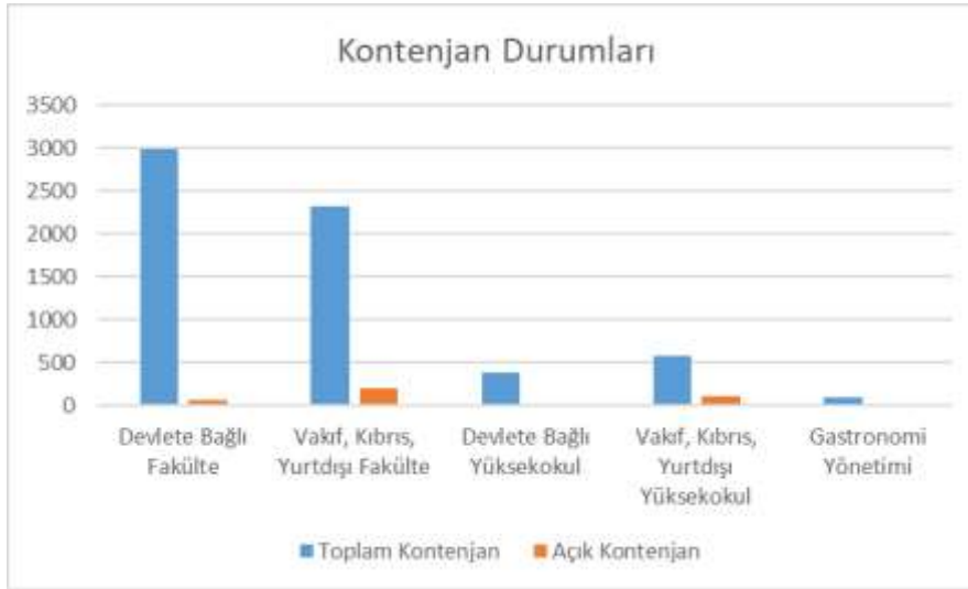
Şekil 1: Gastronomi ve Mutfak Sanatları Bölümlerinin Kontenjan Dolulukları

Vakıf, Kıbrıs ve yurtdışı fakültelerde tam burslu veya % 75 burslu kontenjanlar yüksek doluluk oranına sahip iken, burs oranları düştükçe açık kontenjan sayıları da artmakta ve genel doluluk oranının düşürmektedir. Turizm ve gastronomi yönetimi programlarından üç okul kontenjan açıklamış ve 2025 yılı tercih kılavuzunda yer almıştır.